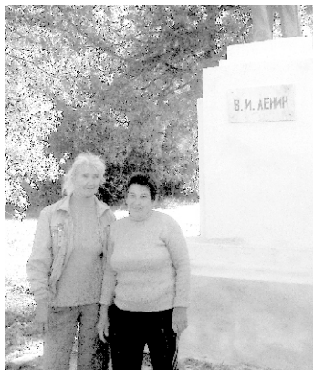
Новости подготовила Лютая С.

20 сентября завершилась реставрация памятника Ленину В.И.